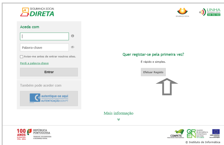
Figura 2 – Registo na Segurança Social Direta

Se não tem Cartão de Cidadão tem que fazer o registo e preencher os seus dados. A consulta ao documento de “Política de Privacidade e Termos de Utilização” é obrigatória, pois só assim pode fazer o seu registo.