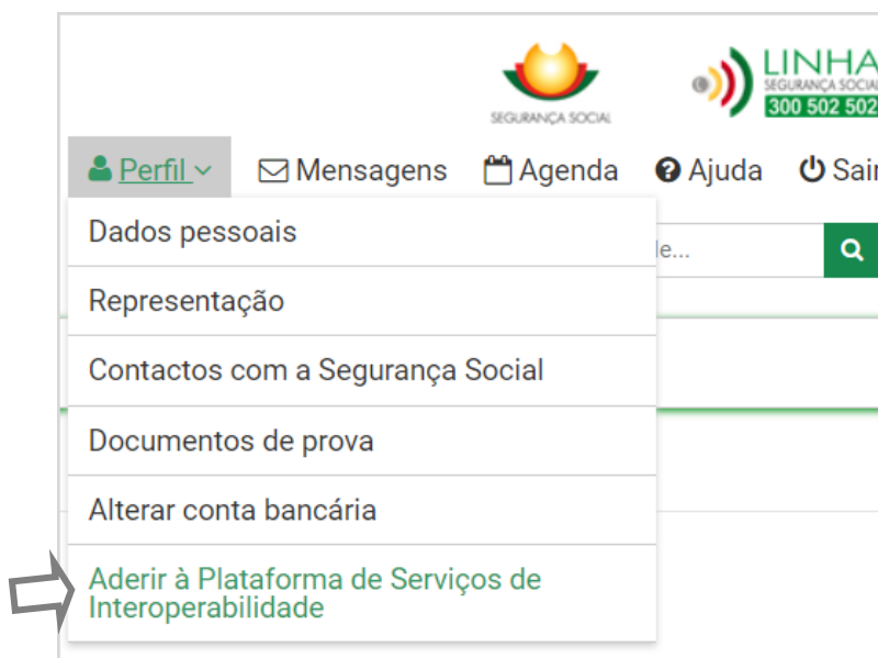
Figura 3 - Aderir

Após acesso à SSD, encontra as condições de adesão à Plataforma de Serviços de Interoperabilidade na opção do menu Perfil .